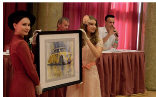
Jeden z dražených předmětů pro Nadaci Terezy Maxové.