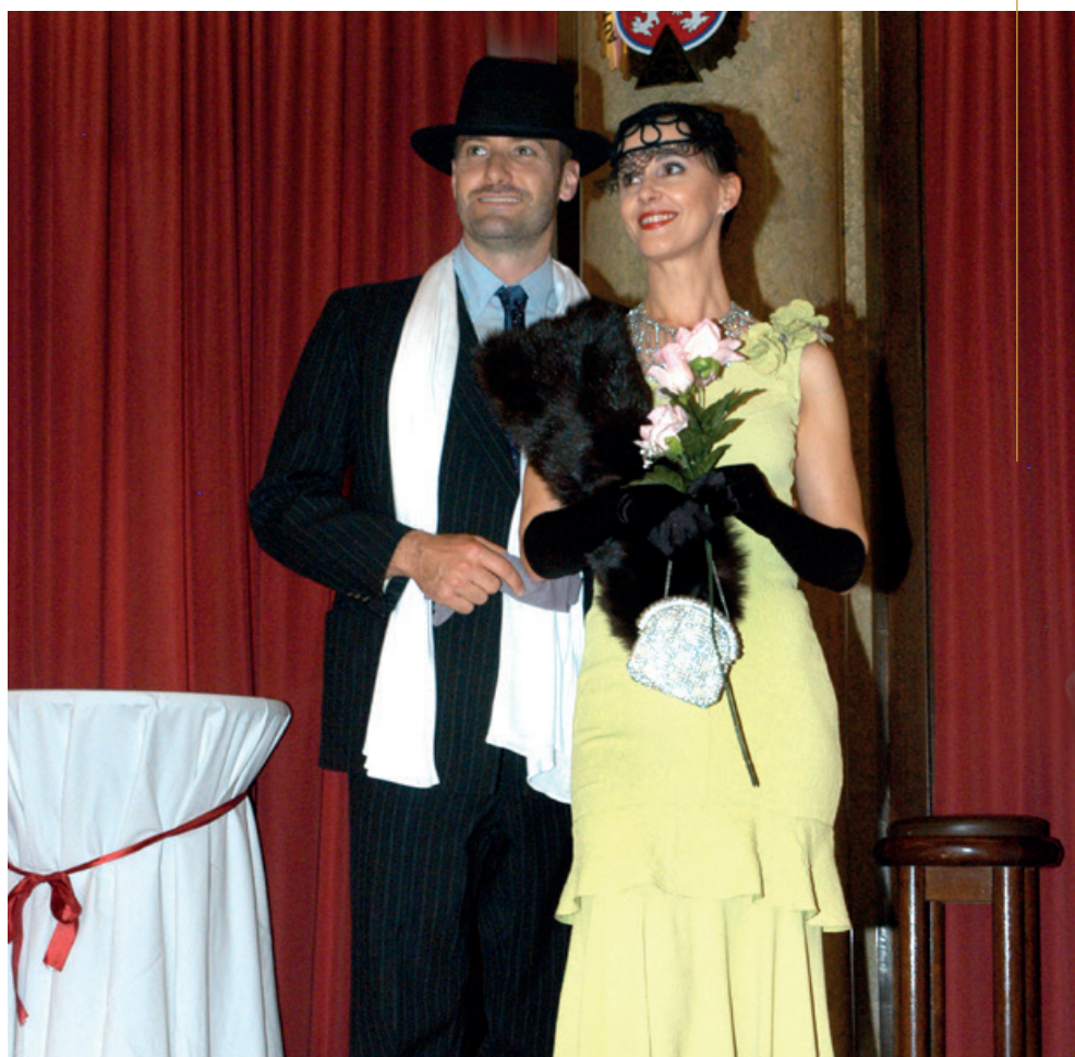
Večerní šaty herečky Adiny Mandlové a tmavý oblek herce Svatopluka Beneše v interiéru Autoklubu ČR.