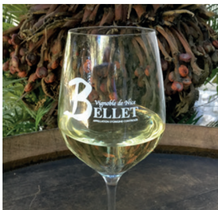
Vína s apelací Bellet se pěstují na pahorcích nad Nice.