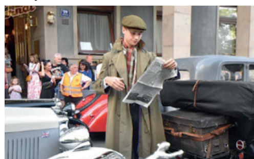
Mladík v nepromokavém kabátě zvaném trenčkot.