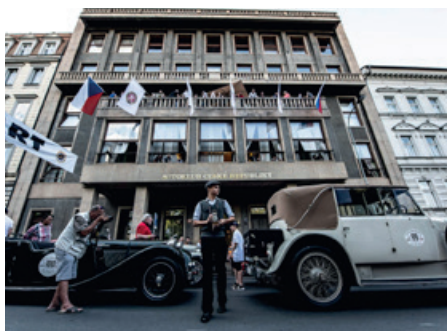
Budova Autoklubu ČR v Praze.