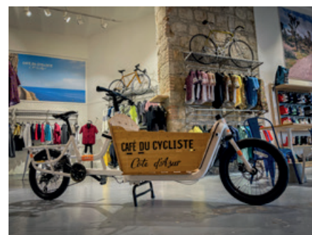
Café du Cycliste v Nice.

ní je datováno do doby železné), takže cestou určitě potkáte řadu řeckých a římských památek včetně amfiteátru. Já jsem stačil jen nakouknout do starého přístavu a spěchal zpět do Nice, protože se blížil večer. Slíbil jsem si ale, že sem někdy příště zajedu autem, protože procházka po antických památkách zabere celý den.