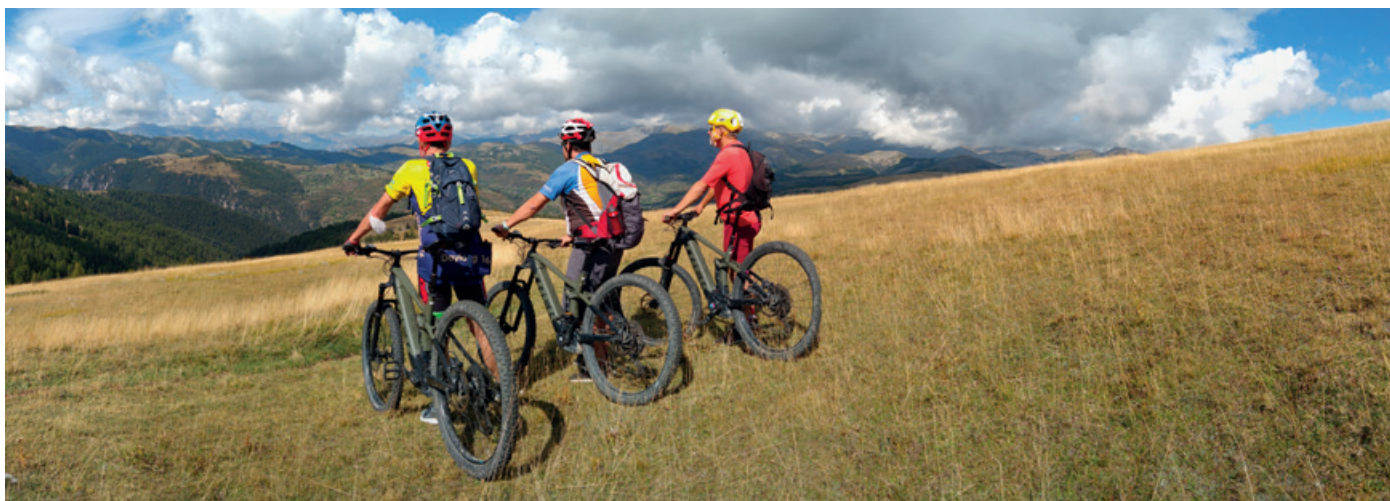
Mercantour je jeden z jedenácti národních parků Francie.

lím kujónů (Vallon de la Couillole) sjíždíme zpět do Roubionu.