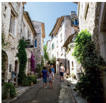
V uličkách Saint-Paul-de-Vence.