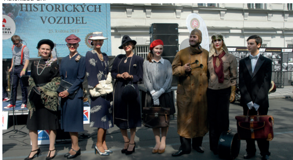
Prezentace dobového oblečení před zahájením přehlídky v roce 2019.