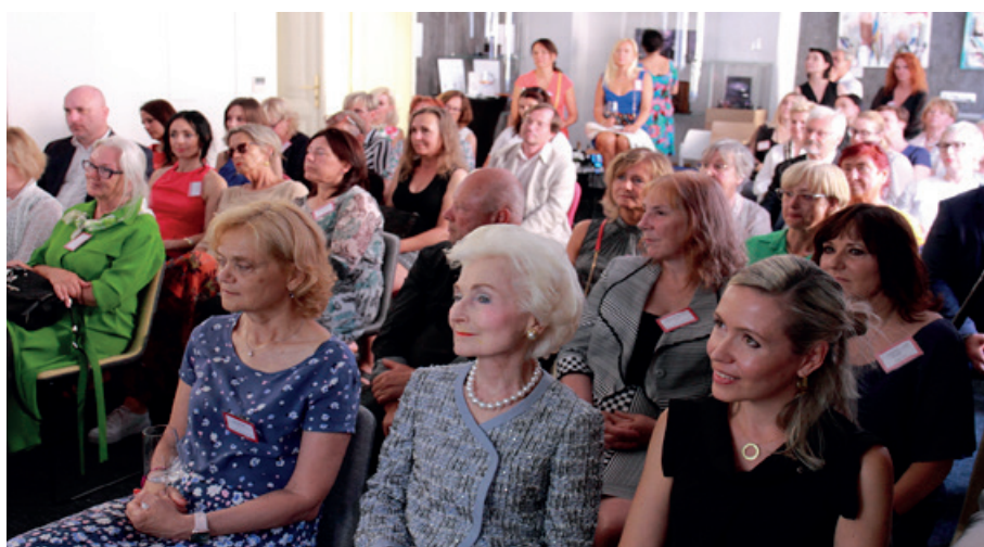
Narozeninové setkání dámského klubu v České mincovně.