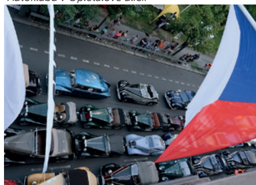
Večer před startem byla auta seřazena podle startovních čísel.