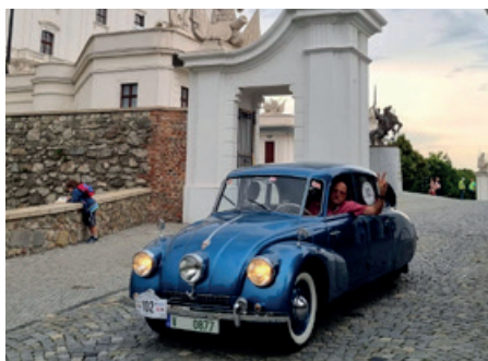
Průjezd Bratislavským hradem.