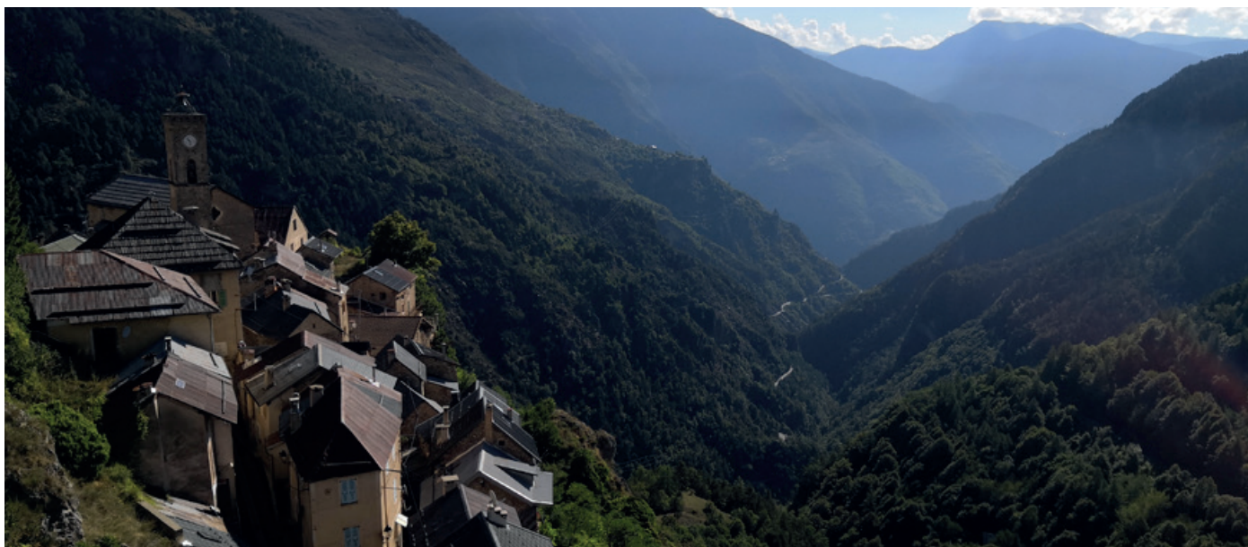
Roubion je malá kamenná vesnička přilepená na stránách horského masivu v srdci národního parku Mercantour.