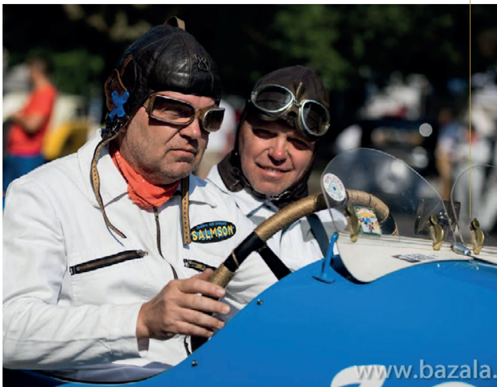
Většina závodníků byla oblečena do dobového automobilového oblečení.

Text: Vladka Dobiášová