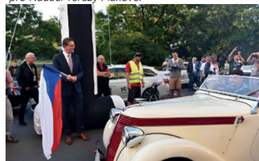
Ranní start se uskutečnil před domem Autoklubu v Opletalově ulici.