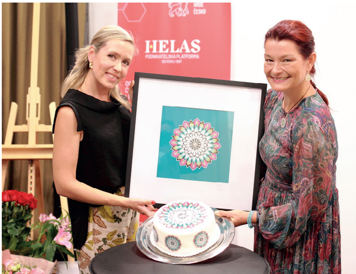
Narozeninové setkání dámského klubu v České mincovně. Představení nové klubové mandaly.