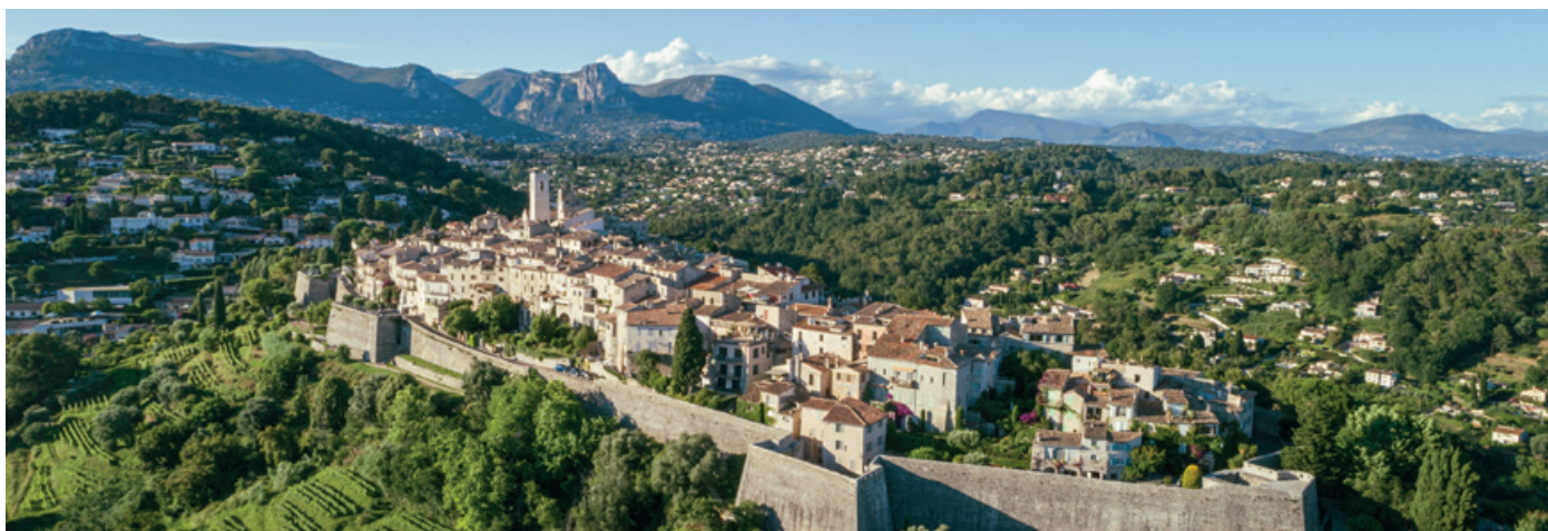
Saint-Paul-de-Vence se tyčí na skalním výběžku ve výšce 350 metrů nad mořem.