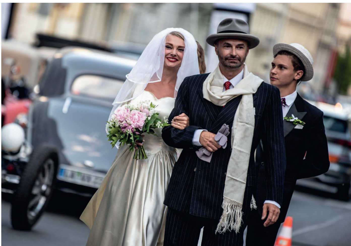
Mottem letošní módní přehlídky bylo propojení automobilů s významnými událostmi lidského života. Tady je jedna z nich, svatba z roku 1938. Samozřejmě, pouze oblečení z té doby...

Druhá akce v loňském roce byla věnována nejen účastníkům závodu a jejich hostům, ale především široké automobilové veřejnosti. Ať už to byli renomovaní odborníci, vášniví automobilisté nebo obdivovatelé historické krásy. S přihlédnutím k této skuteč-