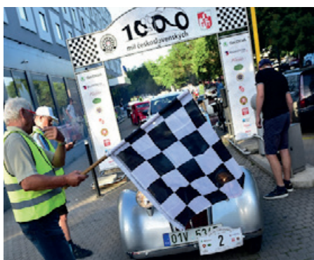
Cíl závodu před pražským Národním technickým muzeem.