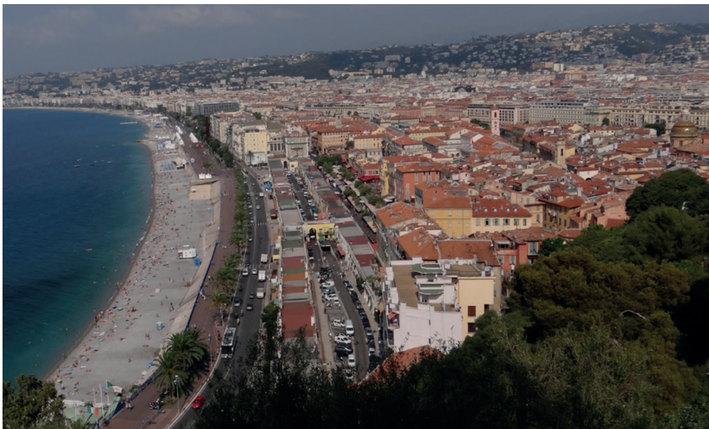
Promenade des Anglais, která se táhne 7 km podél moře.

Řekli byste – vždyť je to plážové letovisko, z jedné strany moře, z druhé Přímořské Alpy... Ale i tady můžete na stránkách tyčících se nad městem narazit na roztroušené „pole s vínem“. Jistě mi prominete trochu té nadsázky: tenhle výraz jsem si vypůjčil z filmu Bobule a vzal ho z úst naprostého vinařského ignoranta, kterého bravurně